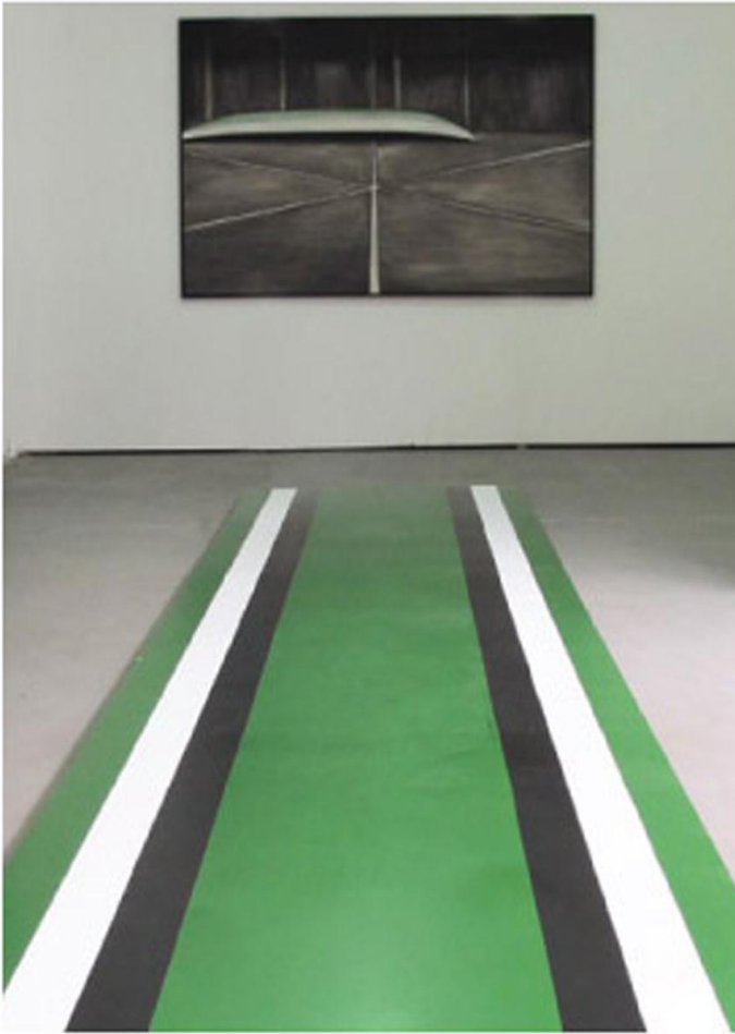
von B nach... acrylique sur toile, 120x120 cm plaque peinte, 120x600 cm, 2012

Diana Seeholzer, née en 1975 en Suisse, Vit et travaille à Küssnacht.