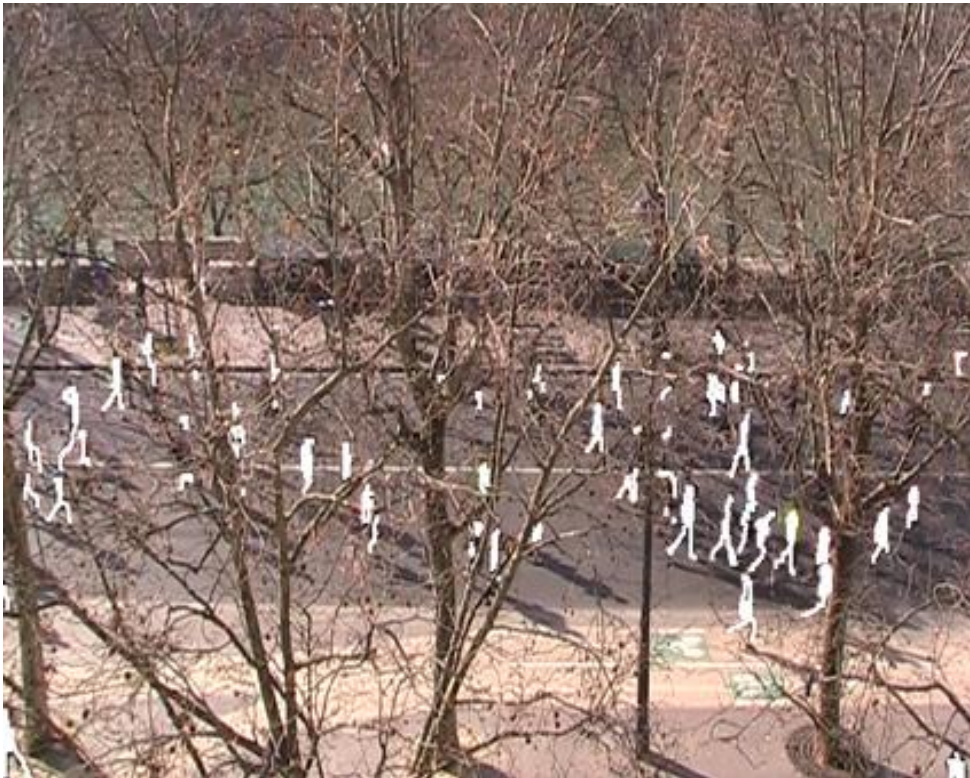
Corrida Vidéo/boucle, 3'02, 2011